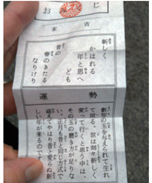
鳩みくじ (鳩の根付入り)