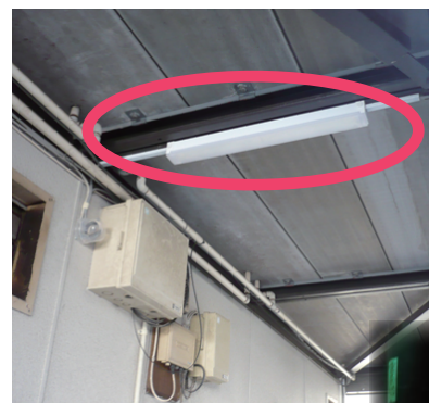
照明点灯時の建物